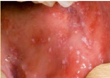
Ранни симптоми на морбили - петната на Коплик по устната лигавица

От 2 - 4 дни след първоначалните симптоми и непосредствено преди появата на обрива се появяват характерните за болестта петна в устната кухина (петна на Филатов -Коплик) - по лигавицата на вътрешната страна на бузите, белезникави на цвят, обградени с червен възпалителен пръстен (приличат на зрънца сол върху зачервена основа). В края на катаралния период настъпва рязко спадане на температурата за около един ден, след което отново се повишава до 40^{\circ} и се появява обривът. Първоначално той започва зад ушите, по лицето и шията, и прогресира надолу, бързо обхващайки тялото и крайниците.